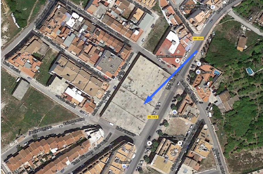
Figura 1. Emplazamiento Parcelas objetos del Plan de Innovación.

En la Figura 1 , se observa el emplazamiento de los sectores objeto del presente informe.