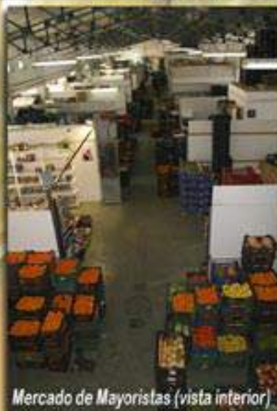
Mercado de Mayoristas (vista interior)

El actual mercado de Mayoristas se construyó en el año 1966, aunque su origen se remonta al año 1787 con la creación del primitivo mercado en "Las cuatro esquinas", pasando en el año 1900 a la Plaza Alta y posteriormente en 1952 a la Plaza de la Legión, trasladándose finalmente a su ubicación actual en Carretera de Cartama.