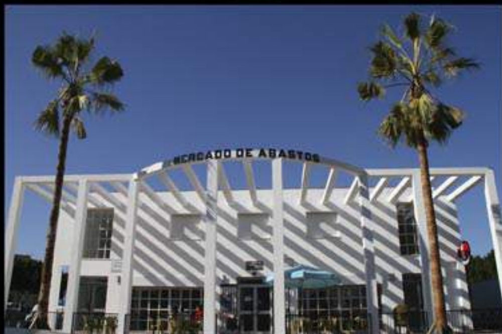
Fachada principal y Bar del Mercado