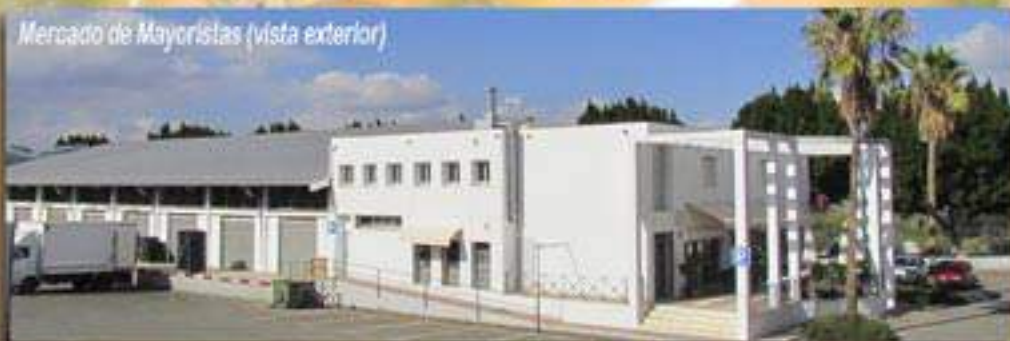
Mercado de Mayoristas (vista exterior)