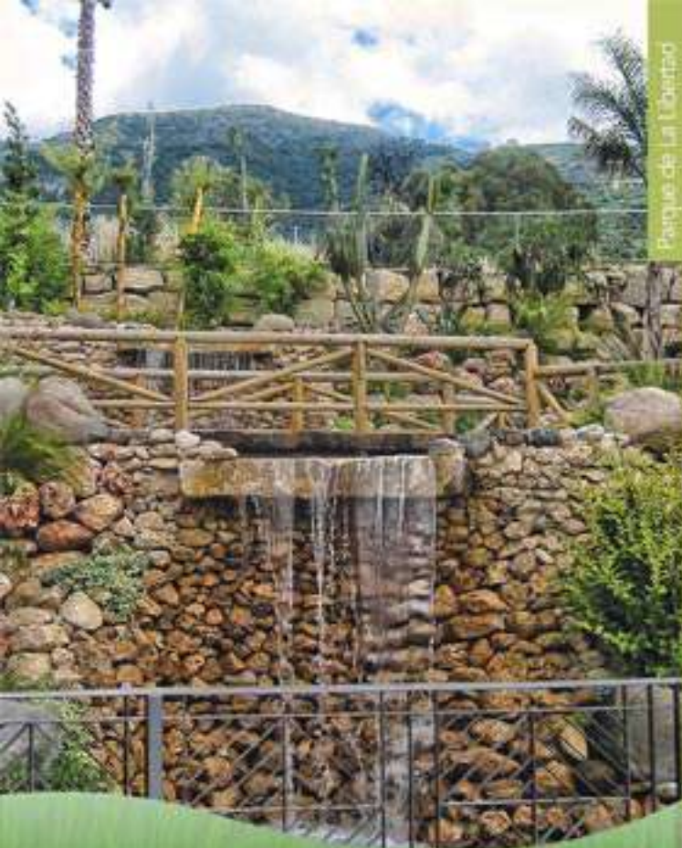
Parque de la Libertad