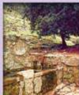
Fuente del Acebuche