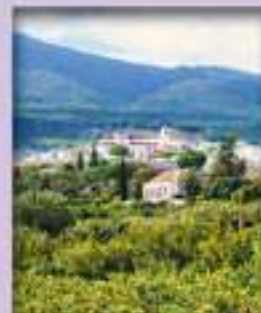
Alhaurín y la sierra